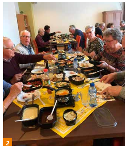
2 Paasgourmet in de Charley Toorop Toren