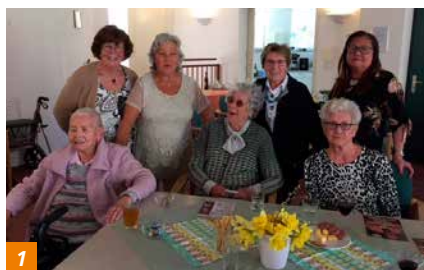
1 Meezingmiddag en opname tv-programma Paul Pakt Uit in Maria Moll

Nieuwtjes uit de gebouwen vindt u op onze Facebookpagina www.facebook.com/sorwonen . Neem eens een kijkje als u zelf actief bent op Facebook. Of plaats zelf een nieuwtje uit uw gebouw! U kunt uw foto en berichtje ook mailen naar communicatie@sor.nl . Wij plaatsen deze dan voor u.