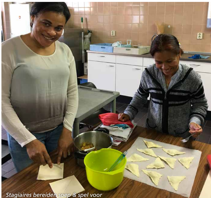
Stagiaires bereiden soep & spel voor

ook over de dagelijkse dingen die ze meemaakt. Bijvoorbeeld dat haar moeder uit Thailand over was of over een recept dat ze heeft klaargemaakt. Ik neem echt mijn petje af voor haar en andere nieuwkomers. Hoe ze hun huishouden combineren met school, de stage en soms de verzorging van hun kinderen. Zolang zij zoveel moeite doet om beter Nederlands te leren, wil ik mij wel blijven inzetten om haar te helpen.”