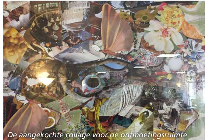
De aangekochte collage voor de ontmoetingsruimte

Enkele jaren geleden is hij begonnen met zijn workshop ‘Collage maken’. Iedere maandagmiddag werkt een groep van zo’n zeven mensen aan de collages. Doordat het aantal collages groeide en de kwaliteit steeds beter werd, besloot Aren exposities te gaan organiseren. Hij woont zelf in de Provenierswijk en besloot dit jaar contact te