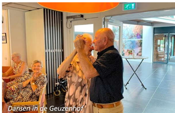
Dansen in de Geuzenhof