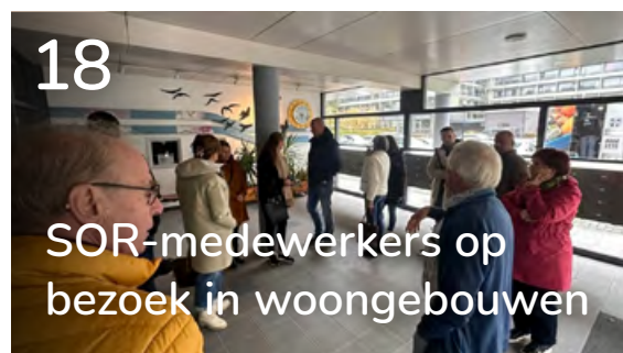
18 SOR-medewerkers op bezoek in woongebouwen

14 Burendag 2023: van biljartworkshop tot oud-Hollandse spelletjes