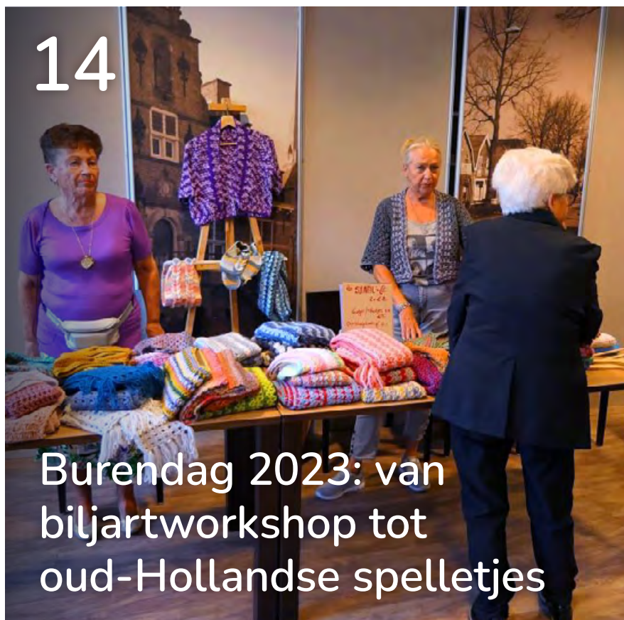
14 Burendag 2023: van biljartworkshop tot oud-Hollandse spelletjes